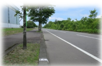
向陽台周回コース