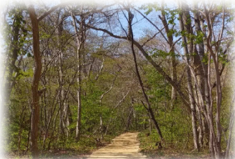
青葉公園周回コース

新千歳空港を擁し、空路・陸路・海路すべてにおいてアクセス抜群な千歳。 夏場の冷涼な気候と豊かな自然環境を有する千歳。 市街地の宿泊施設は、陸上競技場やランニングコースまで徒歩圏内にあり、新千歳空港からは車で10分程度。 千歳市は、陸上合宿とホクレン・ディスタンスチャレンジを全力サポート!!