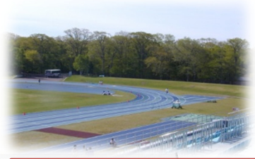
千歳が誇るトレーニングコース!