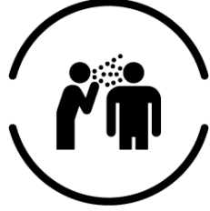
会話・大声エチケット