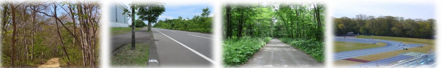
青葉公園周回コース

新千歳空港を擁し、空路・陸路・海路すべてにおいてアクセス抜群な千歳。 夏場の冷涼な気候と豊かな自然環境を有する千歳。 市街地の宿泊施設は、陸上競技場やランニングコースまで徒歩圏内にあり、新千歳空港からは車で10分程度。 千歳市は、陸上合宿とホクレン・ディスタンスチャレンジを全力サポート！！