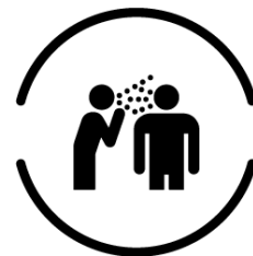
会話・大声エチケット