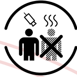
サーモグラフィカメラによる 体温測定の実施