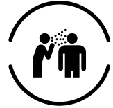
会話・大声エチケット