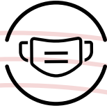
マスク着用をお願い