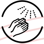
アルコール消毒のお願い