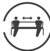
ソーシャルディスタンスの確保