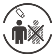
サーモグラフィカメラによる 体温測定の実施