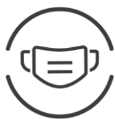
マスク着用のお願い