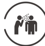
会話・大声エチケット