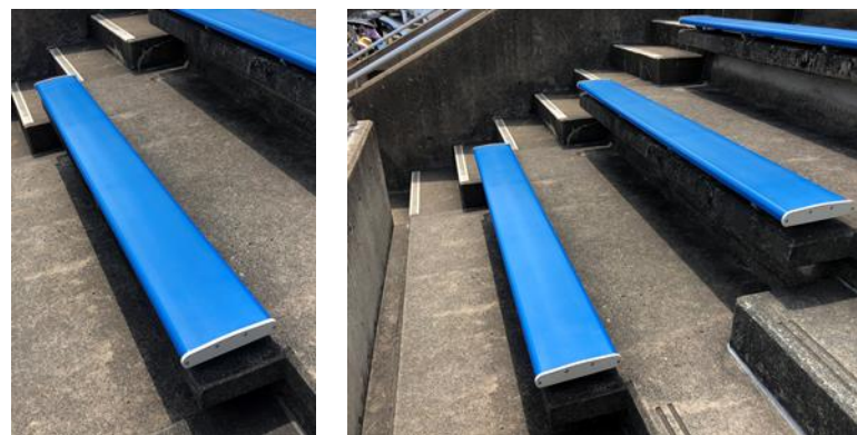
全て撤去します（破棄対応）