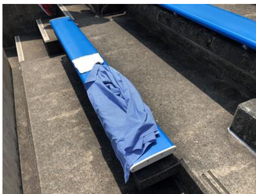
タオル・衣服等による確保

主催者もしくは管理者が過剰な席取りと判断した場合、座席に置いてある敷物等を撤去 または縮小します。尚、その際に生じた 破損や汚れ、紛失は一切責任を負いません。 予めご了承をお願いします。