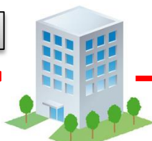
西濃マネジメントセンター